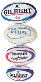
■由上而下分別是5號至2號波，5號是成人波，其他則小童專用。