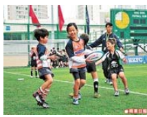
■欖球的傳球方法是向後傳，傳球時還要用腰力，球先會傳得遠。