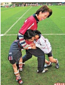
■推、拉、擒抱是欖球的基本動作，連帶可學習戰術及訓練團體合作精神。

現每逢周日便是顏家的 Family Day of Rugby。「欖球會鼓勵大人與小朋友一同參與，希望爸爸媽媽成爲義工或教練，所以每星期都似嘉年華，小朋友又可識到大班朋友，親子關係亦好了！」不過作爲爸爸，顏先生避免擔任兩姊弟的教練，以免破壞親子關係，「我唔會對他們的球技、體能等有任何建議，始終要尊重教練，閒時最多講講欖球睇睇比賽，唔會干預他們的欖球。」