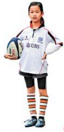
■欖球裝備簡單，衫褲長襪及球鞋，球鞋爲普通的膠底釘鞋。